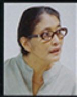
ヤマナカ・ノートル