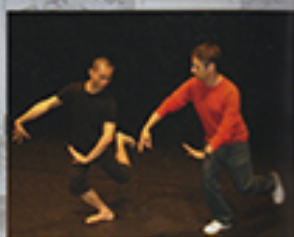
IMPULSTANZ 2013 WELTMUSEUM WIEN